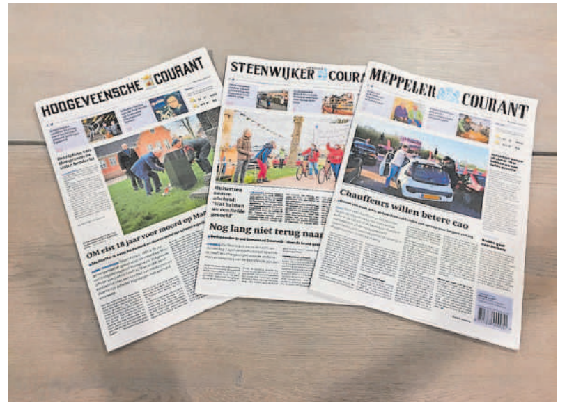
Drie van de zeven betaalde nieuwsbladen die bij NDC blijven.

Aankopen en initiatieven uit het recente verleden worden de komen-