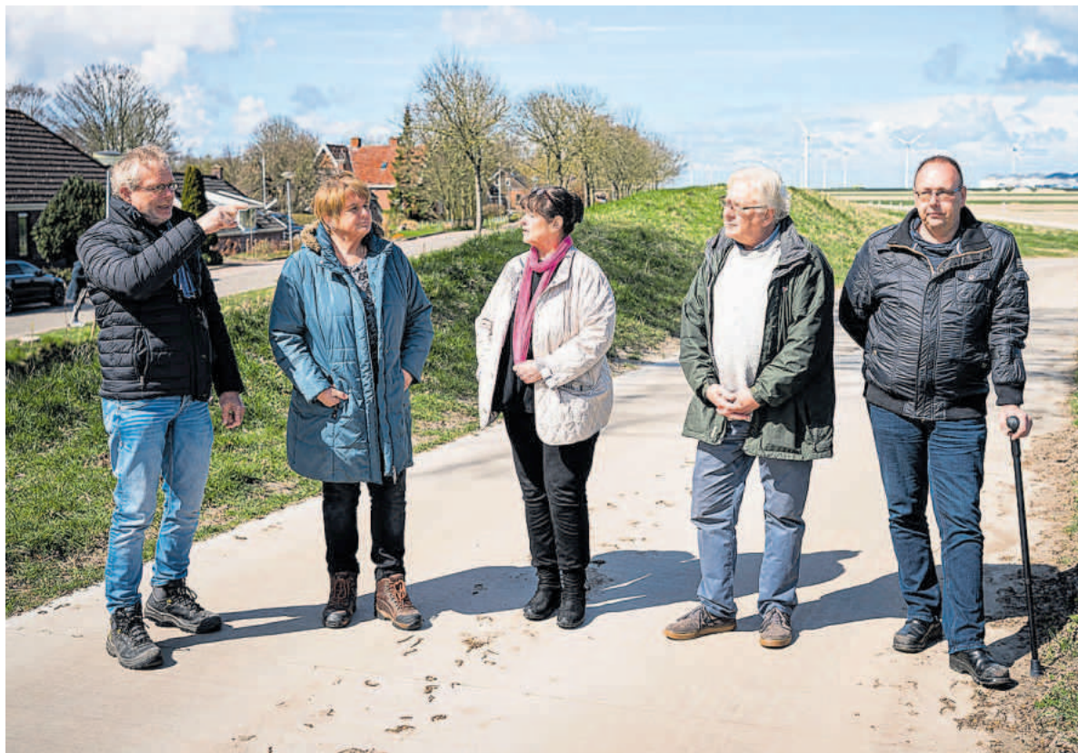
De inwoners van Oudeschip zijn bezorgd over de toekomst van het meest noordelijke dorp van Groningen.