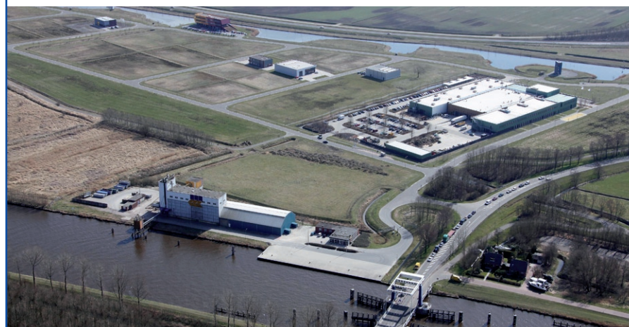
Op de voorgrond Graansilo Appingedam aan het Eemskanaal met op de achtergrond het Bedrijvenpark Fivelpoort